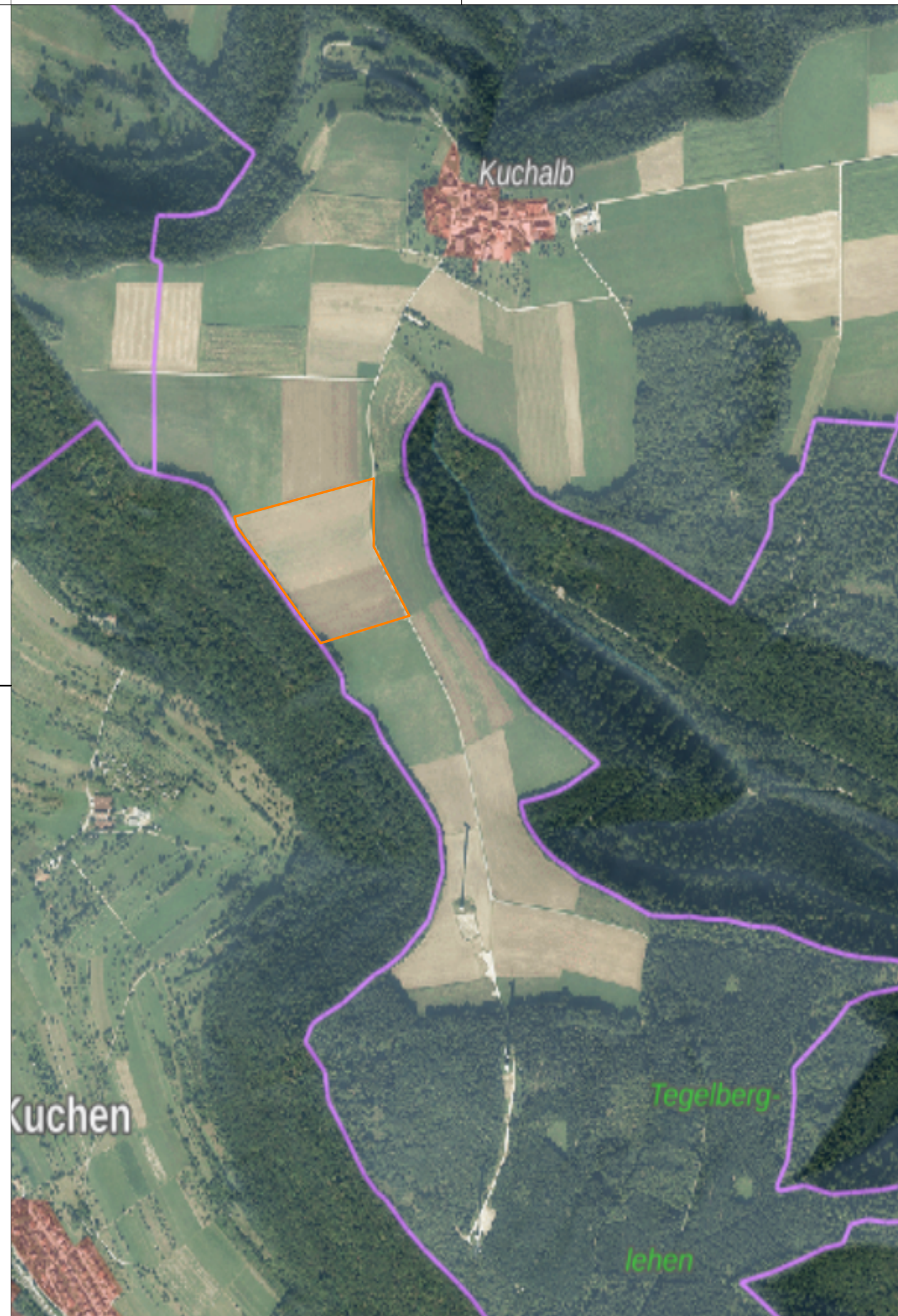
Übersichtslageplan ohne Maßstab

Gemeindeverwaltungsverband Mittlere Fils – Lautertal