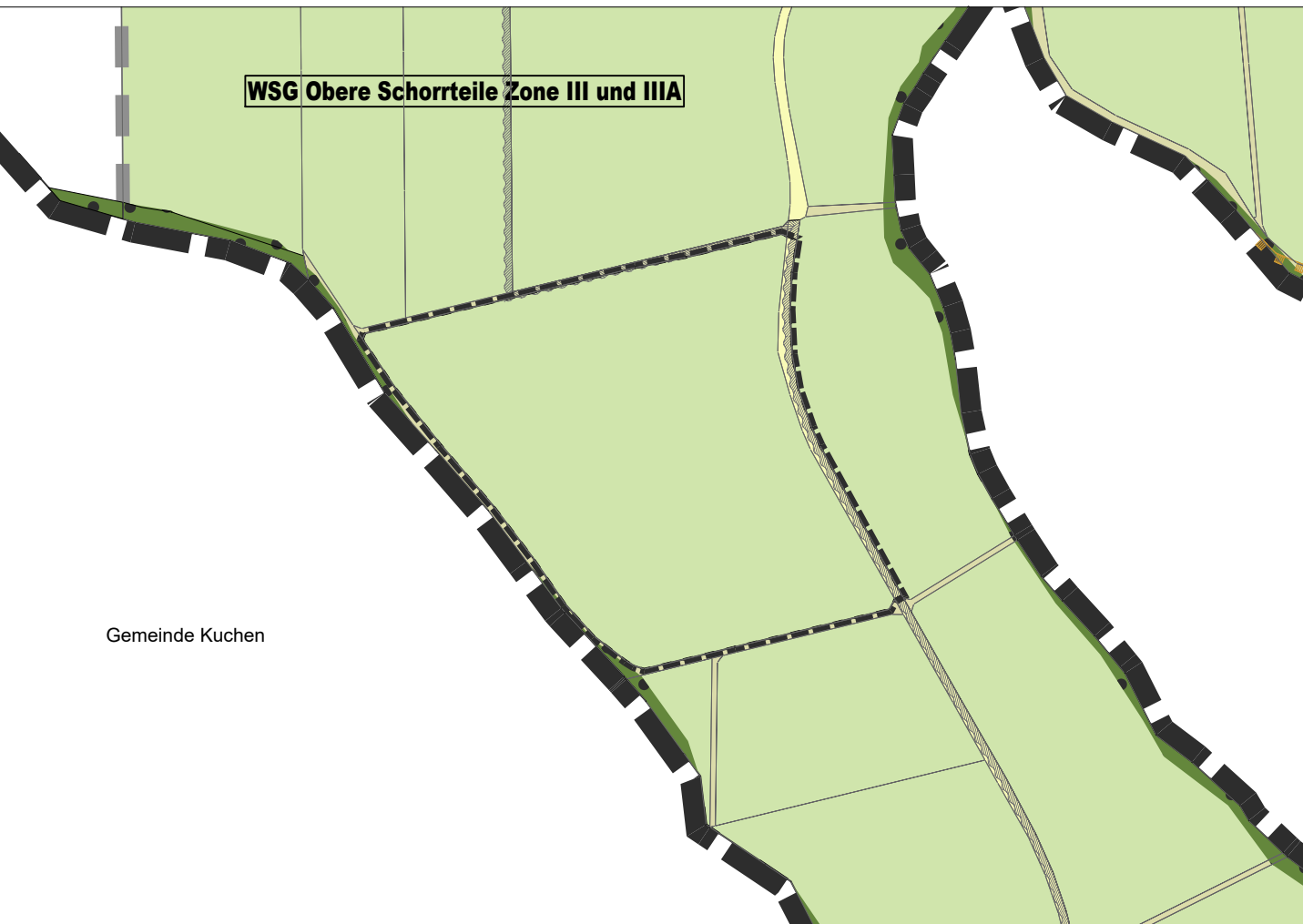
FNP 2035 vom 29.05.2020 M 1:5.000