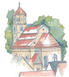
Mariä Himmelfahrt Weißenstein