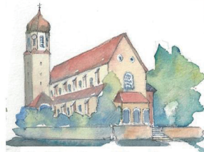
St. Martinus Nenningen