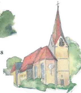
St. Martinus Donzdorf