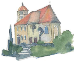
St. Sebastian und Rochus Winzingen

Unterrichtsangebot der Musikschule Donzdorf