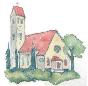
St. Petrus Reichenbach