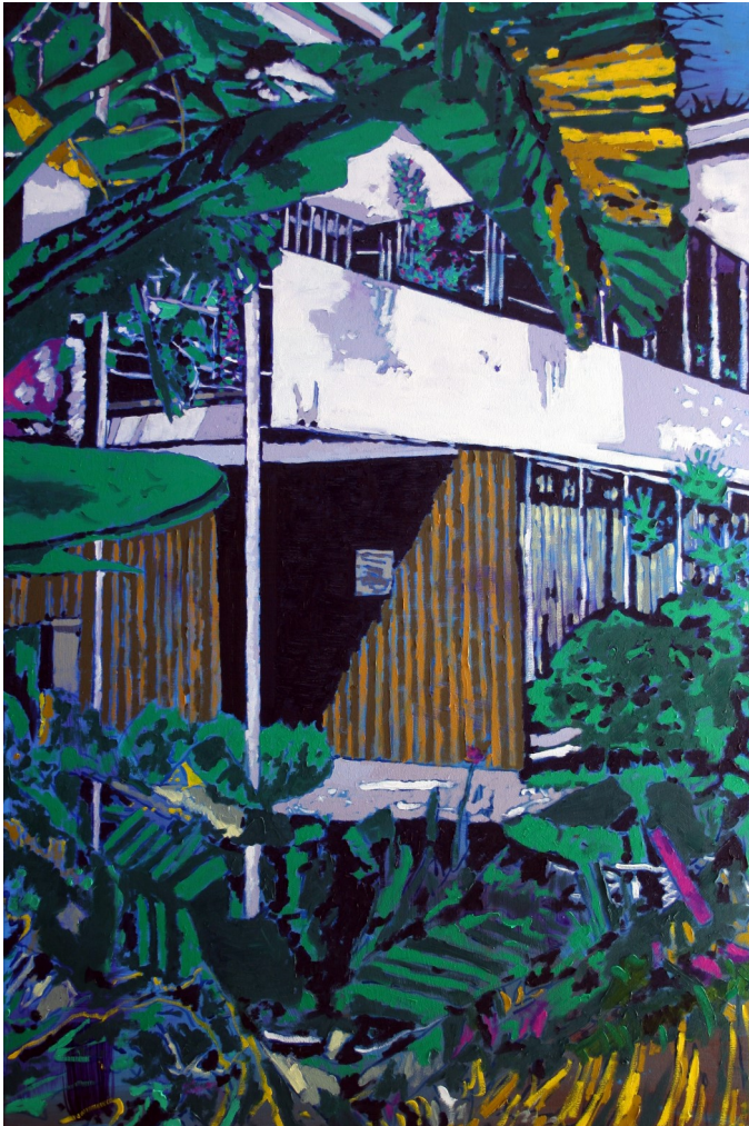
© Willem Julius Müller, Eingang, Öl auf Leinwand, 80 x 120 cm, 2023

Vernissage am 28.04.2024, 11 Uhr, Roter Saal, Schloss Donzdorf